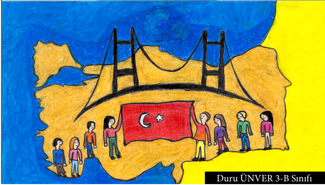
Duru ÜNVER 3-B Sınıfı