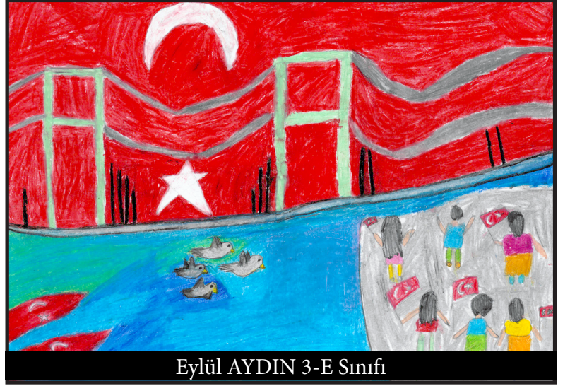
Eylül AYDIN 3-E Sınıfı