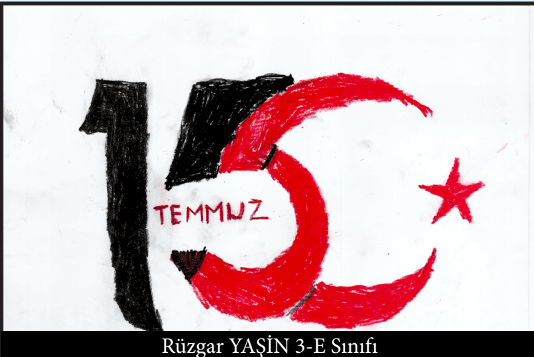
Rüzgar YAŞIN 3-E Sınıfı